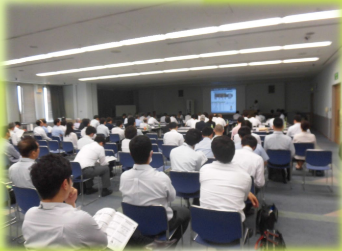
現場の活性化につながる改善事例が多数