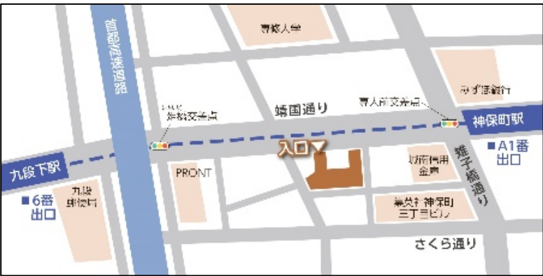
〒101-0051 東京都千代田区神田神保町3-3 神保町SFⅢビル5階