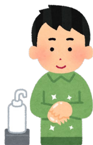
アルコール消毒液等の設置