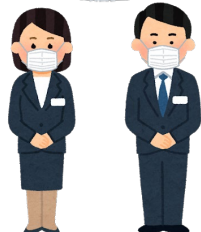
職員のマスク着用