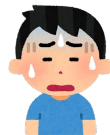
体調不良時は お申し出ください