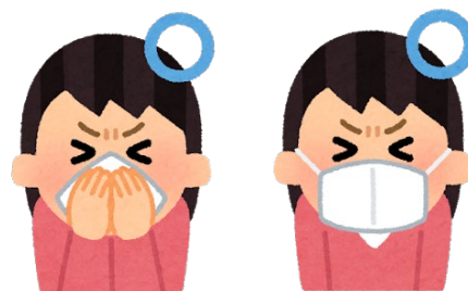
マスク着用と 咳エチケットの徹底