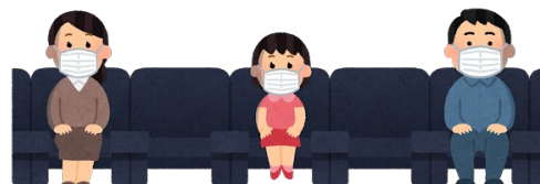
ソーシャル ディスタンスの確保