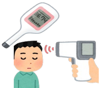
来場者の体温測定