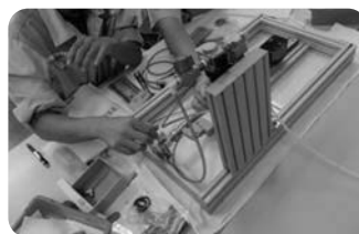
システム組み付けキット 実践編