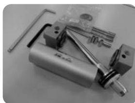
機器分解キット 実践編