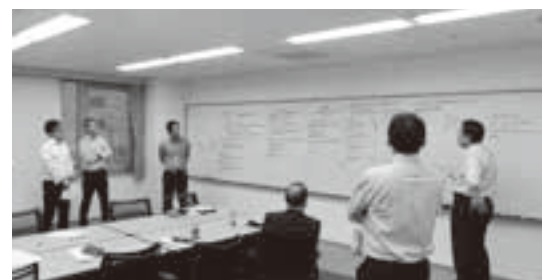
グループ討議風景